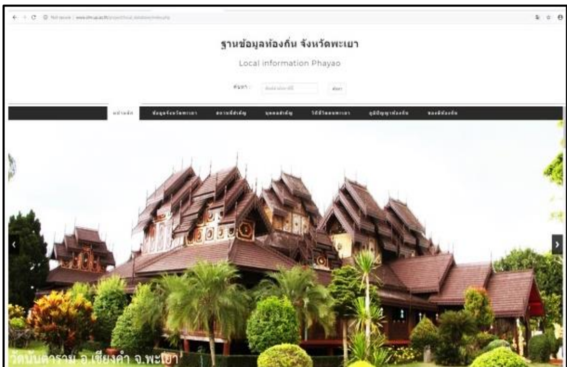
ภาพที่ 1 หน้าเว็บไซต์ข้อมูลท้องถิ่นจังหวัดพะเยา