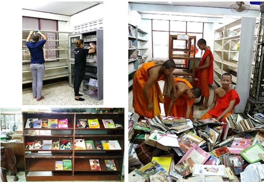
ภาพที่ 3 การจัดห้องสมุดในห้องสมุดวัด