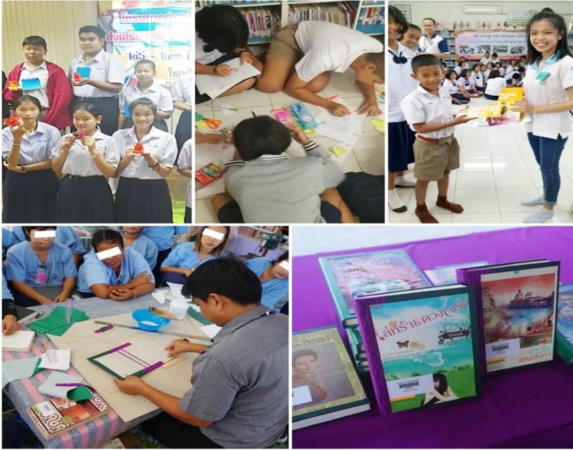
ภาพที่ 3 การจัดกิจกรรมส่งเสริมการอ่านและการซ่อมบำรุง