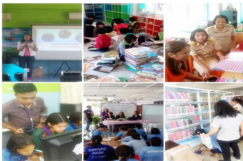
ภาพที่ 2 การจัดอบรมเชิงปฏิบัติการระบบห้องสมุดอัตโนมัติและการลงรายการ