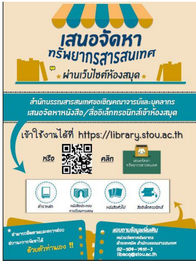
ภาพที่ 1 ภาพการประชาสัมพันธ์เสนาอวดหาทรัพยากรสารสนเทศผ่านเว็บไซต์ห้องสมุด

3. ร่วมคัดเลือกทรัพยากรสารสนเทศจากกิจกรรม Book Fair หรืองานเลือกสรรหนังสือ เป็นกิจกรรมที่ห้องสมุดจัดขึ้นเป็นประจำทุกปี ในช่วงเวลาไตรมาสแรกของงบประมาณประจำปี เพื่อให้สอดคล้องกับระยะเวลาการใช้งบประมาณและความทันสมัยของสื่อการศึกษาที่บริษัท/ร้านค้า มาจำหน่าย ระยะเวลาในการจัดงานเลือกสรรหนังสือประมาณ 1-2 วัน โดยเชิญร้านค้าที่เข้าร่วม กิจกรรมจำนวนประมาณ 30-50 ร้าน กลุ่มเป้าหมายที่จะมาร่วมเลือกสรรสื่อการศึกษาคืออาจารย์ ของมหาวิทยาลัย จำนวน 402 คน โดยมีบุคลากรของหน่วยจัดหาทรัพยากร ฝ่ายเทคนิค สำนักบรรณสารสนเทศ เป็นผู้ดำเนินการจัดกิจกรรม Book Fair ดังนี้