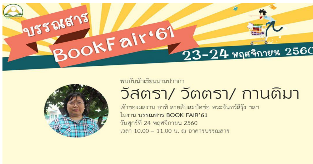
ภาพที่ 2 โปสเตอร์ประชาสัมพันธ์งานบรรณสาร Book Fair ปีงบประมาณ พ.ศ. 2561

3.2 การร่วมกิจกรรม อาจารย์ลงทะเบียนหน้างานโดยกรอกแบบฟอร์มการลงทะเบียน ประกอบด้วยชื่อ-นามสกุล หน่วยงานที่สังกัด e-mail และเบอร์โทรศัพท์ และรับแบบฟอร์ม การคัดเลือกเพื่อเสนอจัดซื้อจำนวน 1 ชุด ประกอบด้วยข้อมูล ชื่อ-นามสกุลผู้คัดเลือก หมายเลข ISBN ชื่อร้านค้า และหมายเลขบาร์โค้ดที่ตรงกับเลขที่ในสมุดลงทะเบียน ซึ่งห้องสมุดกำหนดให้อาจารย์ สามารถคัดเลือกหนังสือเพื่อเสนอจัดซื้อได้ท่านละประมาณ 10-15 ชื่อเรื่อง ทั้งนี้จะขึ้นอยู่กับจำนวนงบประมาณที่ห้องสมุดได้รับจัดสรรในแต่ละปีงบประมาณ