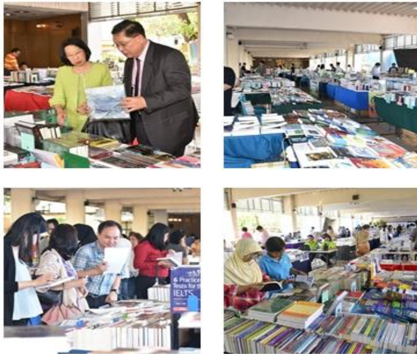
ภาพที่ 3 กิจกรรมการเลือกสรรหนังสือในงาน Book Fair

4. คัดเลือกทรัพยากรสารสนเทศจากร้านหนังสือโดยตรง เป็นโครงการที่หน่วยจัดหาทรัพยากรได้จัดขึ้นเพื่อเพิ่มช่องทางให้อาจารย์ได้ร่วมคัดเลือกหนังสือจากร้านจำหน่ายหนังสือได้โดยตรง มีร้านจำหน่ายหนังสือที่เข้าร่วมโครงการ จำนวน 6 ร้าน คือ 1. ศูนย์หนังสือจุฬาลงกรณ์มหาวิทยาลัย 2. ศูนย์หนังสือมหาวิทยาลัยเกษตรศาสตร์ 3. ศูนย์หนังสือมหาวิทยาลัยธรรมศาสตร์ สาขาท่าพระจันทร์ และสาขารังสิต 4. ศูนย์หนังสือสื่อภาษา สาขาเมืองทองธานี 5. ร้านหนังสือ Kinokuniya สาขาสยามพารากอน และสาขาเอ็มควอเทียร์ และ 6. ร้านหนังสือ P.B. For Book (ปทุมธานี) โดยมีวิธีดำเนินการ ดังนี้