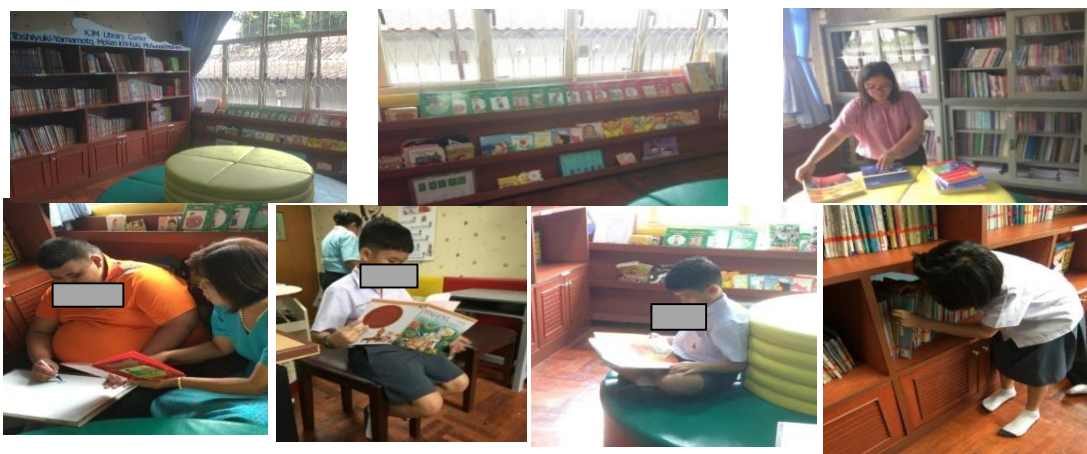
ภาพที่ 1 สภาพห้องสมุดศูนย์วิจัยฯ และพฤติกรรมการใช้ห้องสมุดเด็กพิเศษ

ทรัพยากรห้องสมุด ประกอบไปด้วย หนังสือประเภทต่าง ๆ อาทิเช่น หนังสือภาพ หนังสืออ้างอิง หนังสือเกี่ยวกับออทิสติก หนังสือความรู้ทั่วไป รายงานวิจัย วิทยานิพนธ์ และสื่อการสอน ฯลฯ ที่เกี่ยวข้องกับเด็กพิเศษ และอุปกรณ์ส่งเสริมการเรียนรู้ พัฒนาการเด็กพิเศษ ที่บุคลากรในศูนย์ได้พัฒนา จัดทำ และใช้จริงในการเรียนการสอน และนอกจากห้องสมุดจะเป็นแหล่งเรียนรู้สำหรับเด็กพิเศษ ผู้ปกครอง บุคลากรในศูนย์ ๆ นักศึกษาฝึกงาน และผู้ดูงาน ฯลฯ ยังใช้ในการจัดการเรียนการสอนด้วย