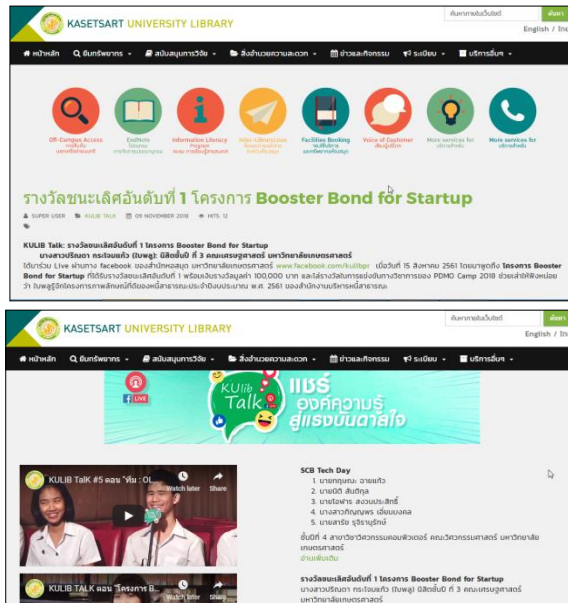
ภาพที่ 4 การสรุปและเชื่อมโยงข้อมูลกับทรัพยากรสารสนเทศของสำนักหอสมุด

4. Internalization เป็นกระบวนการเรียนรู้จากการกระทำซึ่งเป็นการเปลี่ยนความรู้ที่ชัดเจนที่อยู่ในรูปของทักษะหรือความสามารถของบุคคล ให้กลับไปเป็นความรู้โดยนัยที่ฝังอยู่ในตัวบุคคล นั้น ๆ เป็นการ “จารึก” ความรู้ชัดเจน เป็นความรู้ที่ฝังลึกในสมองคน เช่น นำความรู้ที่เรียนรู้มาไปปฏิบัติจริง ผู้ปฏิบัติจะเกิดการเรียนรู้ให้เกิดเป็นความรู้ประสบการณ์และปัญญา เป็นประสบการณ์อยู่ในสมองในเชิง Tacit Knowledge ต่อไป