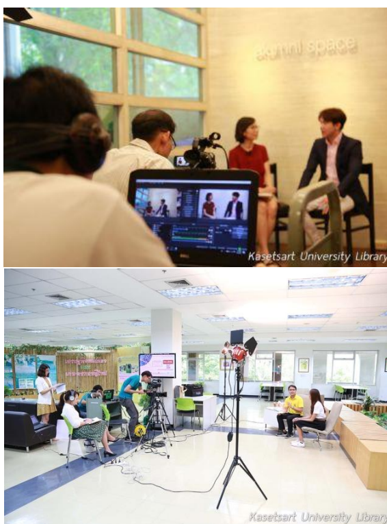
ภาพที่ 3 การนำโปรแกรม OpenSource: OBS Studio มาบริหารจัดการวิดีโอและอุปกรณ์ต่าง ๆ

3. Combination เป็นการแลกเปลี่ยนความรู้แบบความรู้ชัดแจ้งไปเป็นความรู้ชัดแจ้ง (Explicit to explicit) เป็นกระบวนการที่ทำให้ความรู้สามารถจับต้องได้ นำไปใช้งานร่วมกันได้โดยการแยกแยะ แบ่งประเภท แล้วนำมาสร้างจัดหมวดหมู่เป็นความรู้ใหม่ สำหรับรายการ KULIB Talk มีกระบวนการรวมความรู้โดยเมื่อมีการถ่ายทอดสดออกไปแล้วนั้น หลังจากจบรายการทีมงานจะสรุปข้อมูลจากผู้ถ่ายทอดและค้นหาทรัพยากรสารสนเทศที่เกี่ยวข้องทั้งสิ่งพิมพ์ บทความ และฐานข้อมูลต่างประเทศมานำเสนอเพื่อต่อยอดความรู้ให้แก่ผู้ชมต่อไป โดยการนำเสนอจะนำขึ้นบนเว็บไซต์ของสำนักหอสมุด ( www.lib.ku.ac.th/kulibtalk ) เพื่อให้สามารถเข้าถึงข้อมูลได้ง่ายจากทุกที่