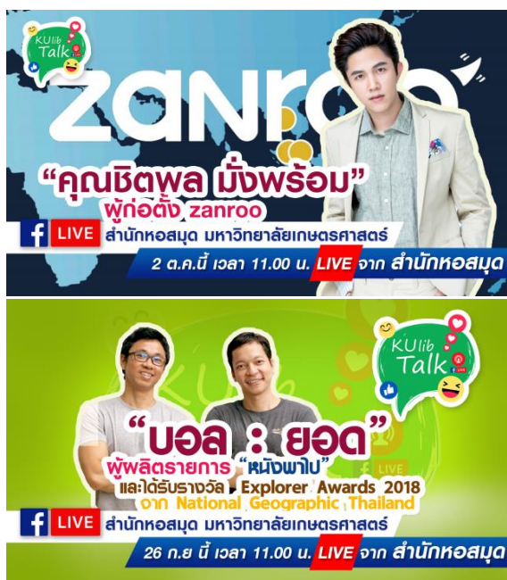
ภาพที่ 2 การจัดทำแบนเนอร์เพื่อใช้ในการประชาสัมพันธ์

การเผยแพร่และออกอากาศไปสู่ผู้ชมรายการ โดยการดำเนินงาน ก่อนการ Live จะมีทีมงาน ประชาสัมพันธ์ข่าวเพื่อแจ้งผู้รับบริการก่อนล่วงหน้าและสร้างแรงจูงใจในการรับชม