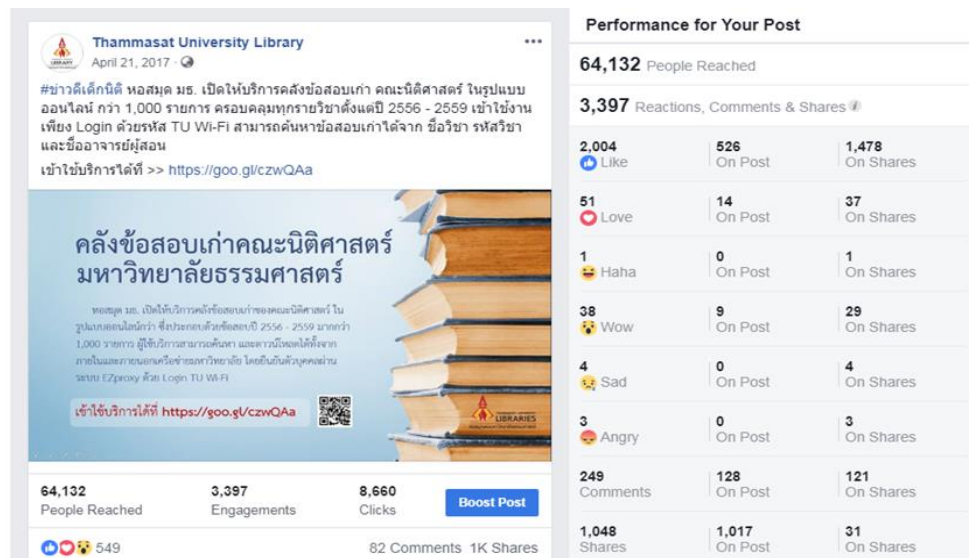
ภาพที่ 2 การประชาสัมพันธ์ผ่านสื่อสังคมออนไลน์

เมื่อดำเนินการนำไฟล์ข้อสอบเก่าเข้าระบบได้ตามแผนการดำเนินงาน ห้องสมุดจึงได้จัดทำเอกสารแนะนำการใช้งานคลังข้อสอบเก่าของคณะนิติศาสตร์และกำหนดวันเปิดให้บริการโดยเลือกช่วงก่อนสอบปลายภาคการศึกษา 1 เดือน โดยประชาสัมพันธ์แนะนำการใช้งานผ่านอีเมล ป้ายโปสเตอร์ จอ LCD ในห้องสมุด และสื่อสังคมออนไลน์ เพื่อให้นักศึกษาทราบว่าห้องสมุดมีข้อสอบเก่าให้บริการในรูปแบบออนไลน์ การประชาสัมพันธ์ห้องสมุดได้เลือกช่องทางที่หลากหลายหากเพื่อต้องการให้เข้าถึงกลุ่มผู้ใช้บริการมากที่สุด ดังภาพที่ 2