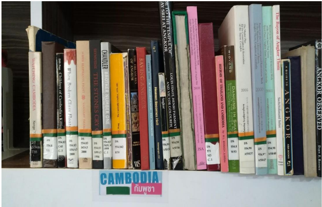
ภาพที่ 5 การจัดเรียงทรัพยากรสารสนเทศบนชั้นหนังสือโดยแยกตามกลุ่มหัวเรื่อง (Subject heading)

4. สํารวจความคิดเห็นของผู้ใช้บริการหลังจากดำเนินการข้างต้นเรียบร้อยแล้ว เพื่อนําคำความคิดเห็นและข้อเสนอแนะไปสู่การปรับปรุงและพัฒนาการจัดเรียงทรัพยากรสารสนเทศในมุมปั่วยเพื่อสุขภาพคนไทยและอาเซียนให้ตรงตามความต้องการของผู้ใช้บริการมากขึ้น