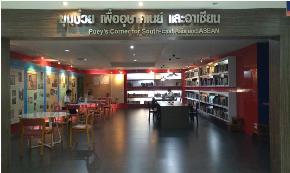
ภาพที่ 1 มุมป๊วย เพื่ออุษาคเนย์ และอาเซียน

หอสมุดแห่งมหาวิทยาลัยธรรมศาสตร์ มีการเตรียมการและดำเนินงานจัดตั้งมุมป๊วย เพื่ออุษาคเนย์และอาเซียน ดังนี้